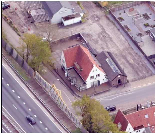
Figuur 1. Luchtfoto vanaf noordelijke zijde