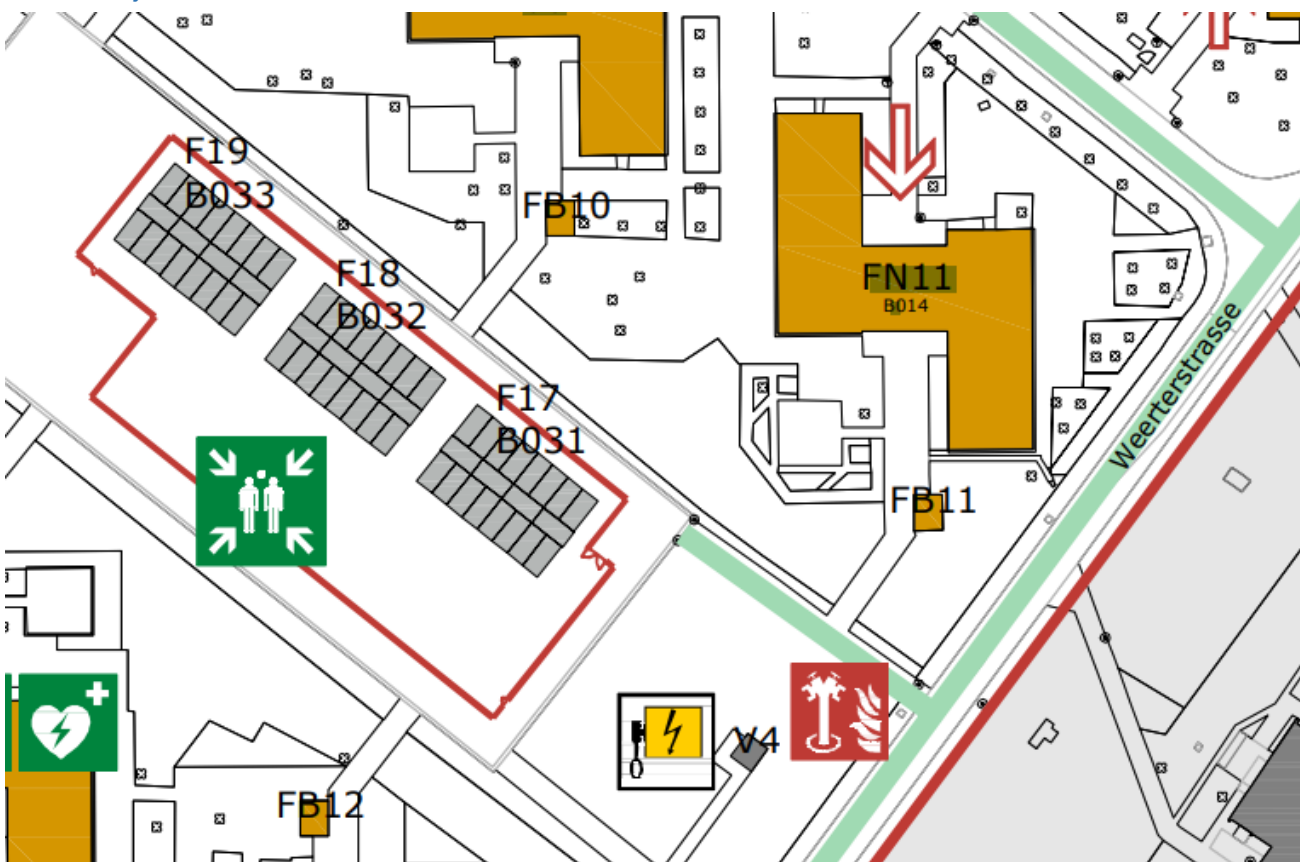
Afbeelding 1: Bereikbaarheid AMV Units

Aardgas: De units van AMV zijn niet aangesloten op het gas.